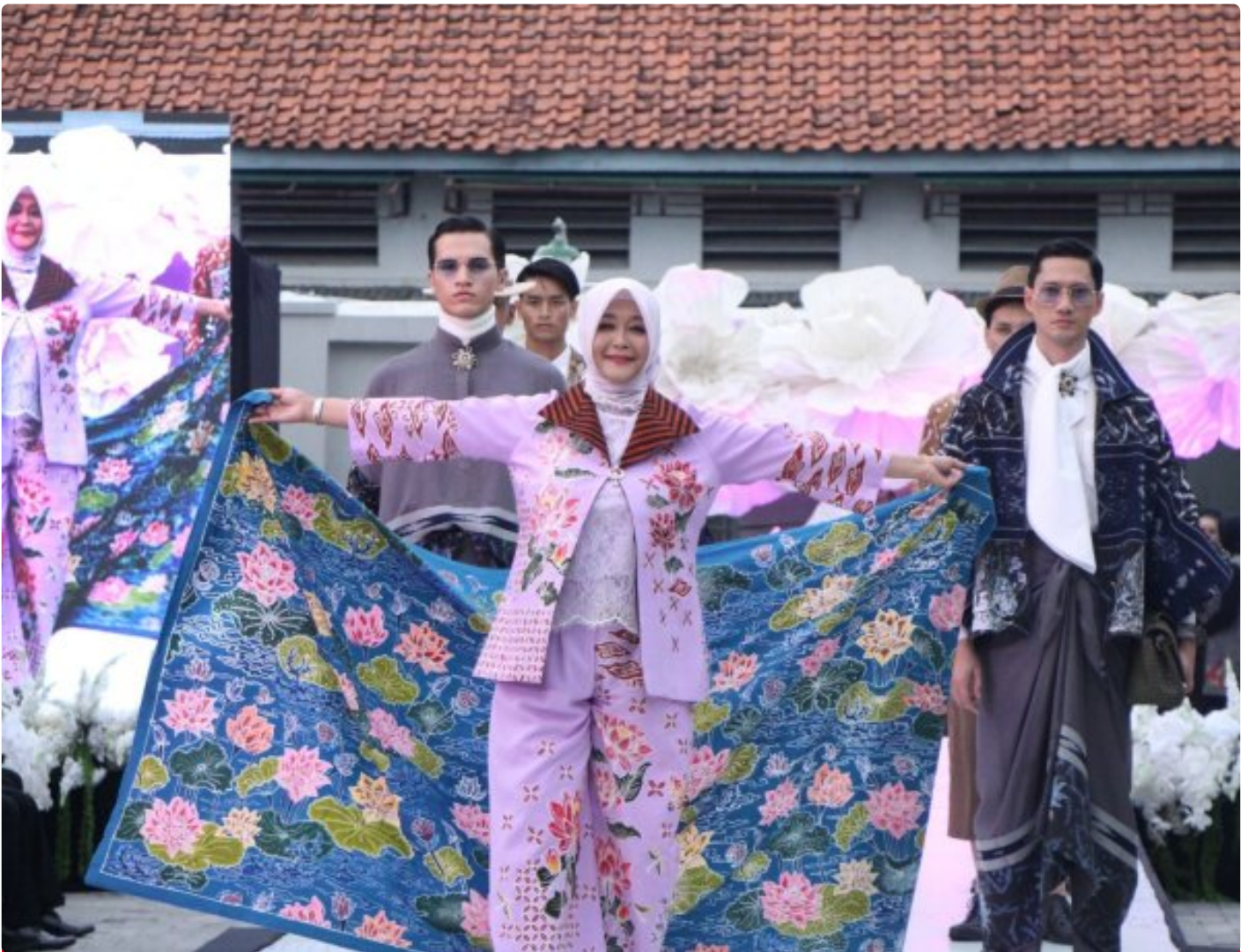
Dari Balik Tangan yang menguatkan Batik Warga Binaan LPP Semarang Bersinar

Semarang — Lembaga Pemasyarakatan (Lapas) Perempuan Kelas IIA Semarang sukses menggelar kegiatan Fashion Show Batik Nusantara bertajuk “Benang Cinta Ibu dari Balik Tangan yang Menguatkan” pada Senin (22/12/2025).