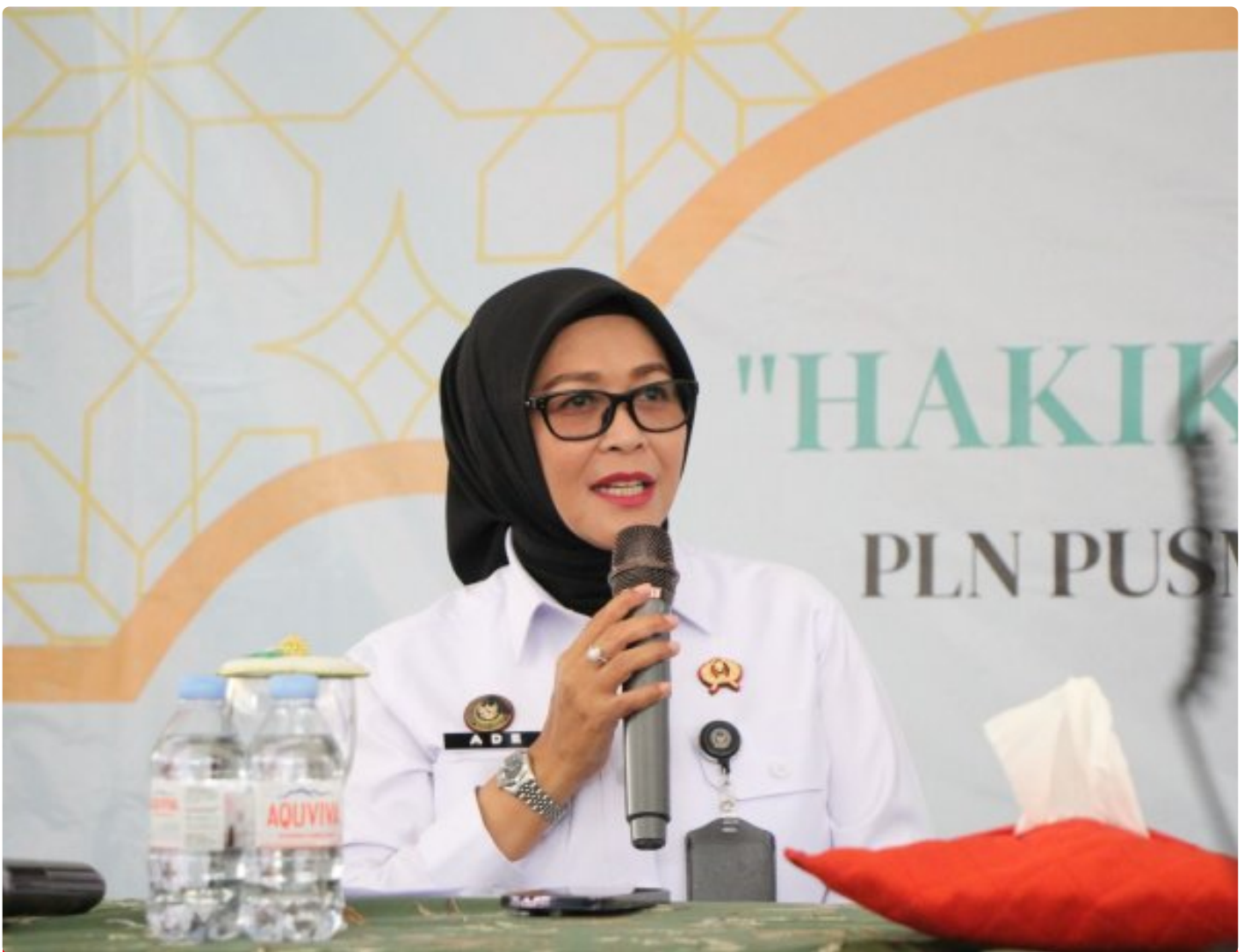
LPP Semarang Bersama PLN Gelar Kajian Keislaman bagi WBP

Semarang -Lembaga Pemasyarakatan Perempuan (LPP) Kelas IIA Semarang bersama dengan PT PLN Pusat Manajemen Proyek (PUSMANPRO) menggelar kajian keislaman yang diikuti oleh seluruh Warga Binaan Pemasyarakatan (WBP). Kegiatan ini dilaksanakan sebagai bagian dari pembinaan kerohanian serta penguatan mental dan spiritual WBP, Selasa (30/12/2025).