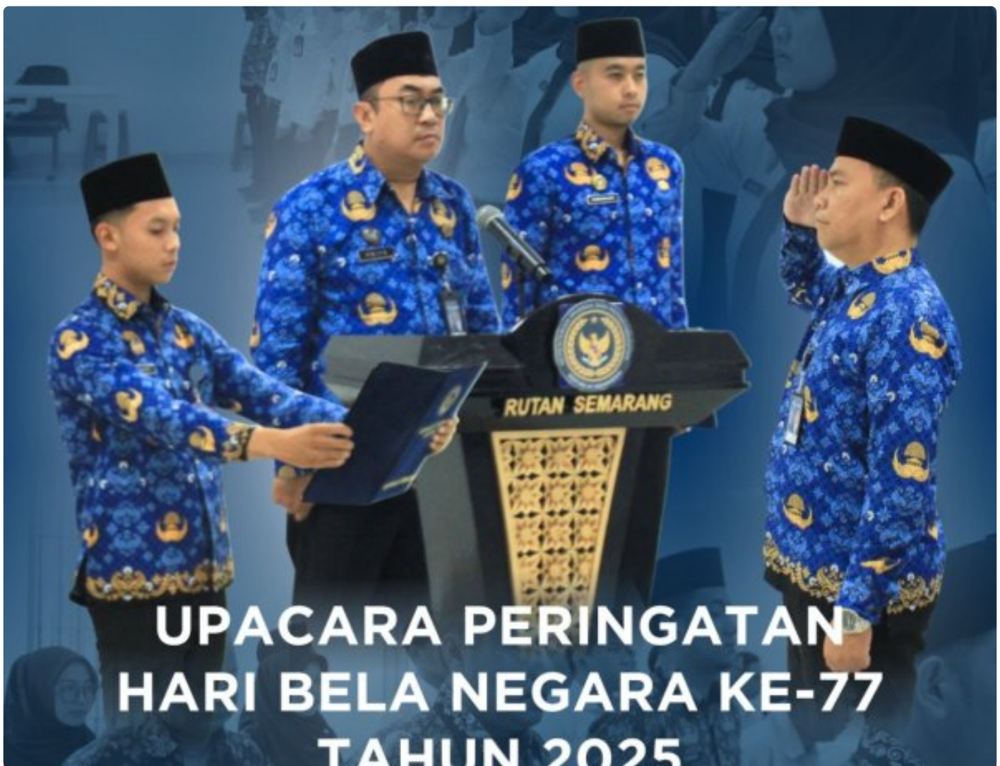
Rutan Kelas I Semarang Gelar Upacara Peringatan Hari Bela Negara ke-77 Tahun 2025

SEMARANG – Dalam rangka memperingati Hari Bela Negara yang ke-77, Rumah Tahanan Negara (Rutan) Kelas I Semarang menyelenggarakan upacara bendera dengan penuh khidmat pada tahun 2025. Kegiatan ini diikuti oleh seluruh jajaran pejabat struktural dan staf di lingkungan Rutan Semarang, Jum'at