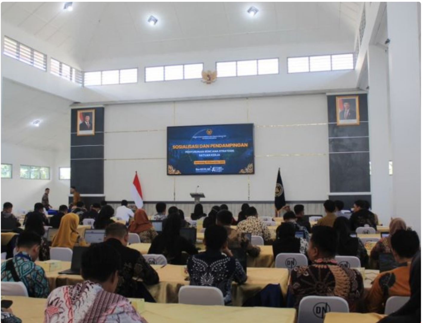
Rutan Wonosobo hadiri Sosialisasi dan Pendampingan Penyusunan Rencana Strategis Satuan Kerja di Lapas Kelas I Semarang

SEMARANG – Rumah Tahanan Negara (Rutan) Kelas IIB Wonosobo menghadiri