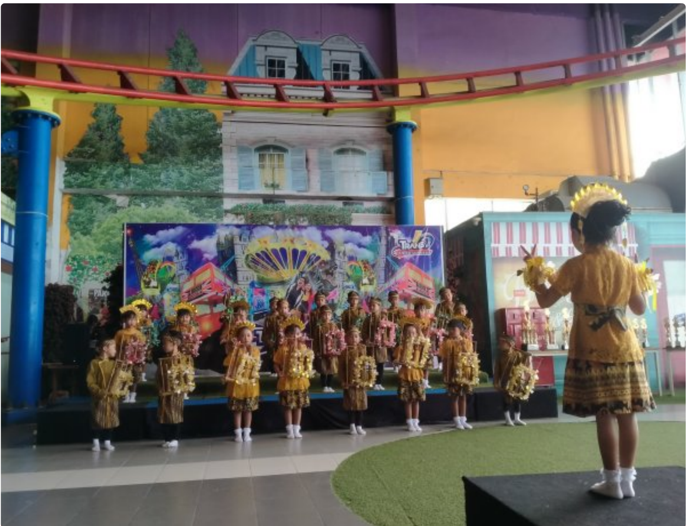
Foto: Anak-anak TK Pelita Pancasila Desa Randugunting, Kecamatan Bergas, Kabupaten Semarang, Jawa Tengah pentas musik tradisional angklung, Kamis (15/1/2026).

KABUPATEN SEMARANG - Semangat melestarikan warisan budaya lokal bergema kuat di TK Pelita Pancasila, Desa Randugunting, Kecamatan Bergas, Kabupaten Semarang. Sekolah ini tak hanya mempersiapkan generasi penerus